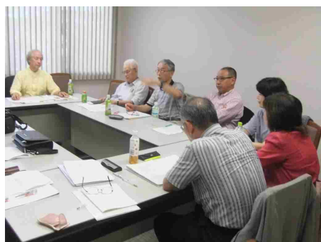
グローバルジャパン研究会 (8月24日)