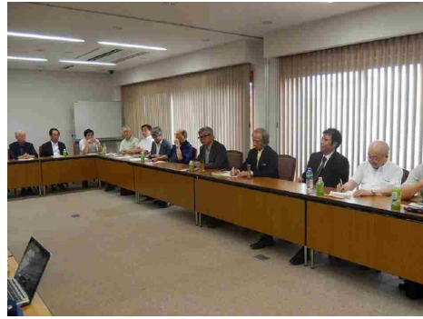
7月全体例会の講演会は会議形式

後の国政を考える必要がある。最近の若者は、好き嫌いははっきりしない新しい文化がある。男女もほぼ同権だ。若者に、戦前の社会を実感してもらうために、昭和八年の社会の空間に戻って、その時の言葉遣い、授業態度、社会常識の中で、授業をしたことがある。学生たちには、痛烈な体験で、どんな授業より歴史を体感できたようだ。官僚の問題も難しい。比較的柔軟な人もいれば、自説を曲げることは屈辱的と頑固の人もいる。 最後に、選挙には投票率で支持政党が左右される。①投票に行かない人に、罰則として税を課するとか、②比例代表制の見直しが必要だ。これは不要だが、若し、残しても議会では、0.5票計算ぐらいではないのか。 二次会で、議論の続きを期